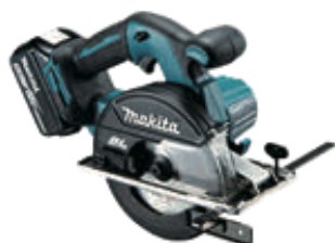
CS551D メーカー: マキタ