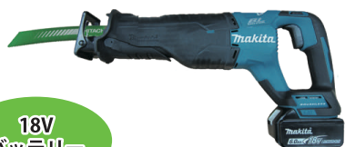
JR187D メーカー: マキタ