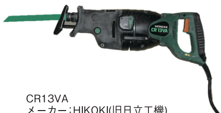
CR13VA メーカー: HIKOKI(旧日立工機)